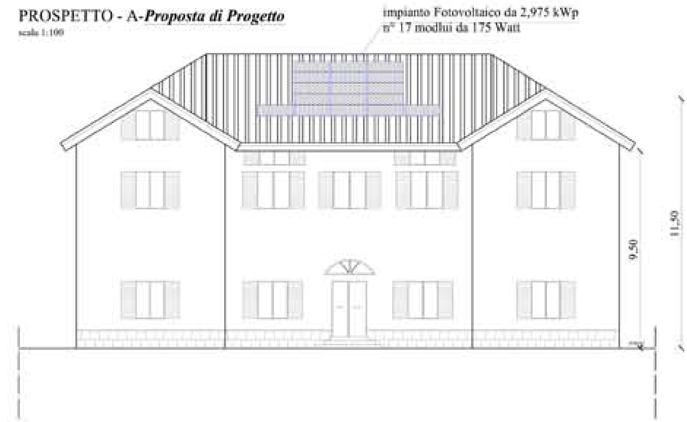
Foto Inserimento Proposta di Progetto